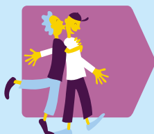
Relaties en seksualiteit