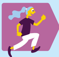
Bewegen en sport