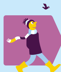
Milieu en natuur