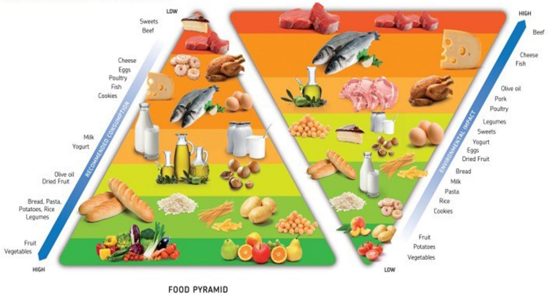
A The Double Pyramid for Adults, 5th Edition